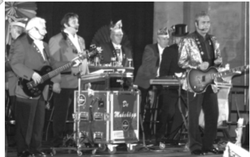
Die Mukeköpp bringen Stimmung in den Saal