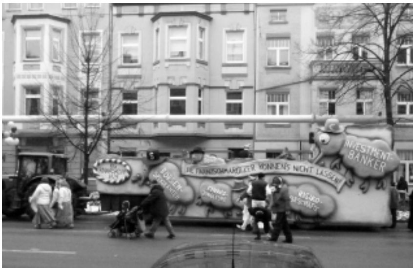
Unser Wagen hat es unbeschädigt bis zur Zugauflösung an der Merowinger Straße geschafft. Morgen landet er auf dem Müll.