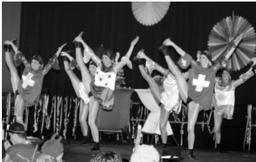
Die Tanzgarde der katholischen Jugend Düsseldorf (Kakaju)