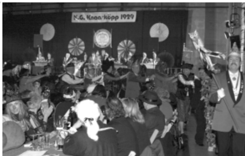
Die Polonäse, ein lustiger Reihentanz quer durch den ganzen Saal