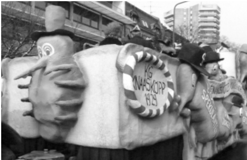
Ein riesiger Blutsauger mit Zylinder zierte die Spitze unseres Wagens und führte zu großer Erheiterung der Knaasköpp.