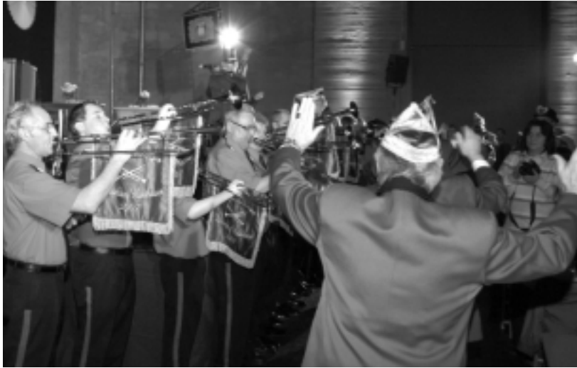
Das neue Fanfarenkorps Düsseldorf-Holthausen eröffnen die Sitzung