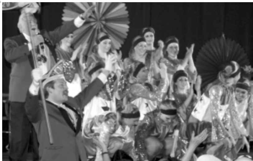
Anmut und Schönheit auf der Großen Sitzung im Meilenwerk