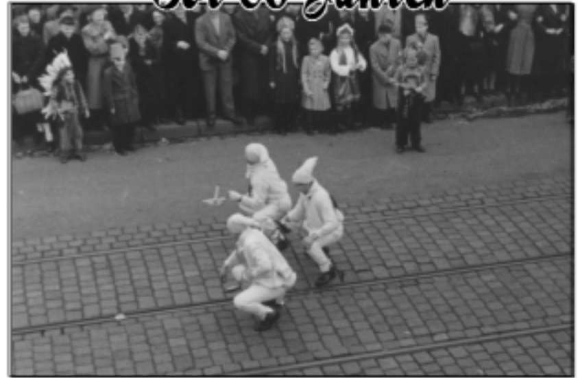
Rosenmontag 1951. Die Knaasköpp als Darmol Männchen, das in der Nacht mit Kerze und Papier auf dem Weg zum „Örtchen“ ist.