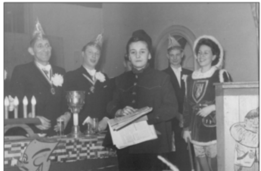
1951 - Damensitzung der Knaasköpp im Düsselheim.