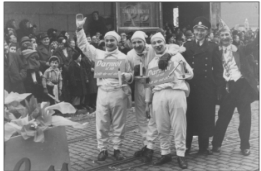
Darmol Männchen - „Wer kennt ihn nicht den Mann mit dem Licht?“