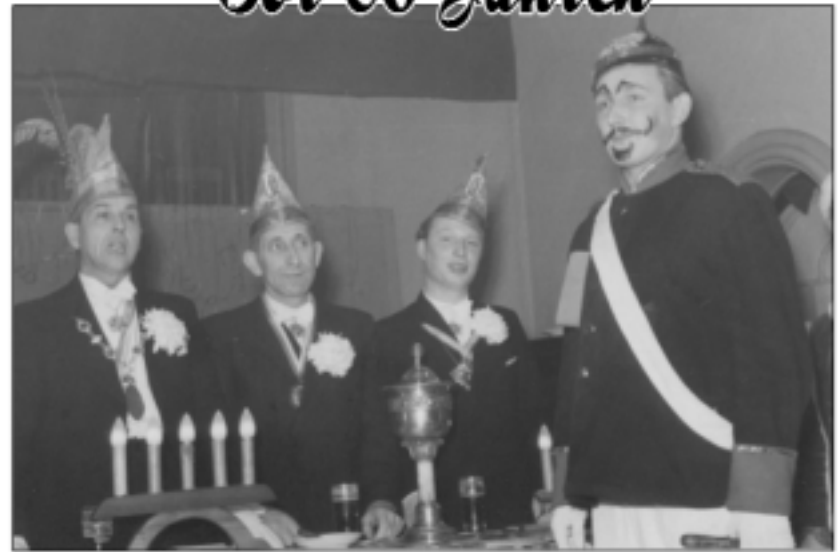
Der närrische Schutzmännchen, mittlerweile eine Traditionsfigur im Düsseldorfer Karneval (1951)