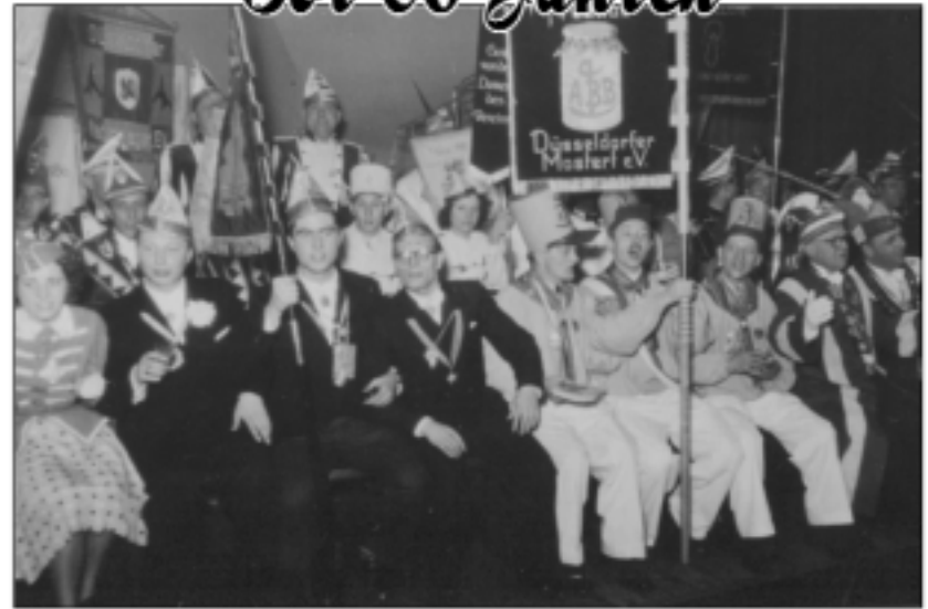
1951. Düsseldorfer Karnevalsvereine feiern die Prinzenkürung.