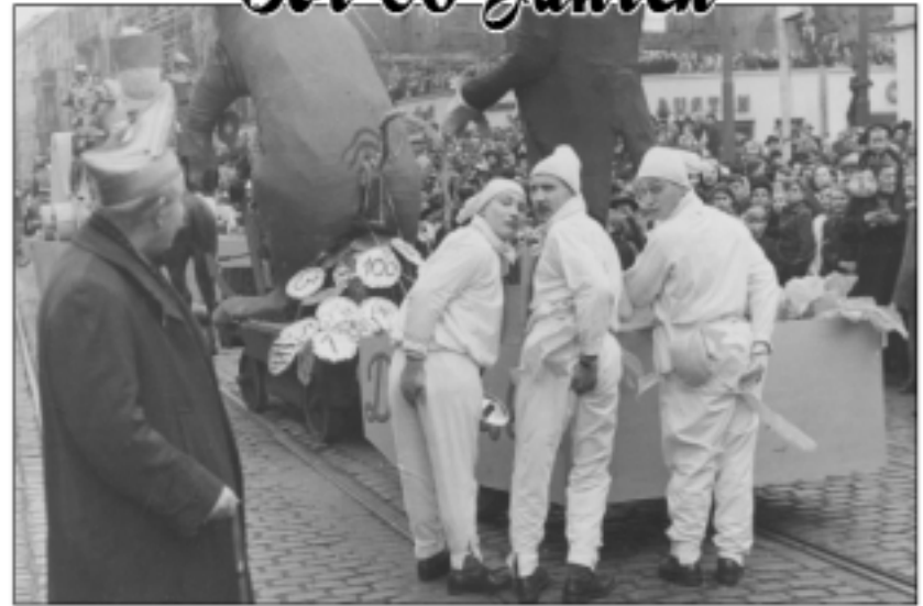
Die Knaasköpp - Rosenmontag 1951. Motto ist „Lachen über alle Grenzen“