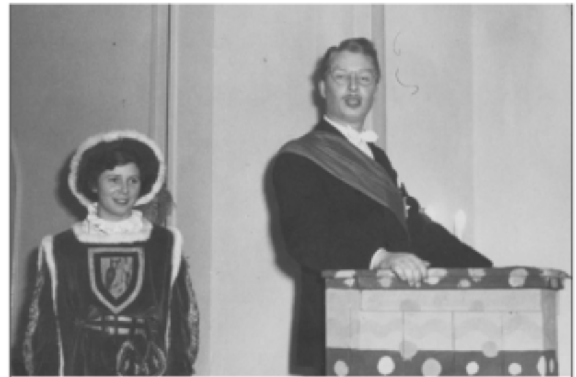
11. November 1950. Der Hoppeditz hält seinen Hopeditz-Prolog.