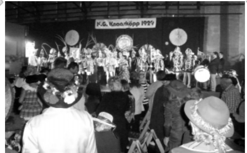
Das Publikum ist begeistert vom Auftritt des Prinzenpaares