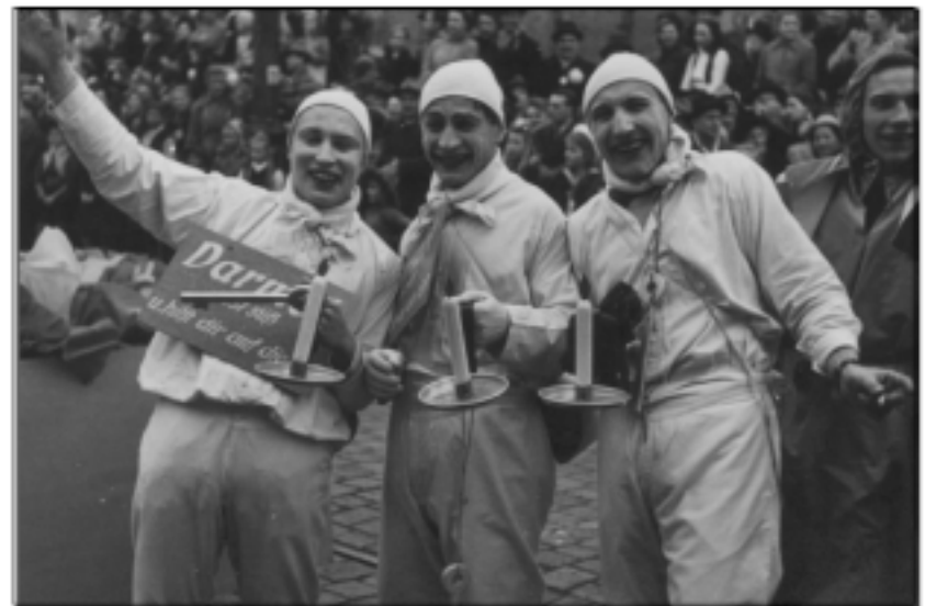
Das Darmol-Männchen war die berühmte Werbefigur für die Darmol Abführschokolade.