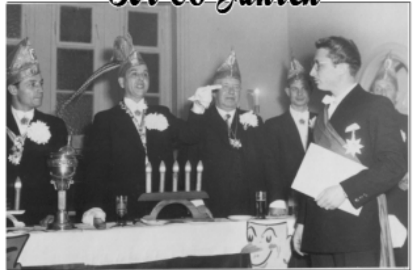
11. November 1950. Hoppeditz-Erwachen in unserem Gründungslokal Düsseldorf.